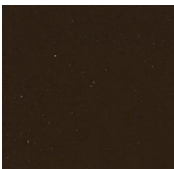
Olive Drab Shade 41