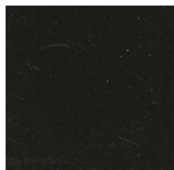
Leave Green FS-34079