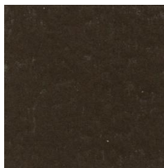
Olive Drab FS-34087 ANA-613